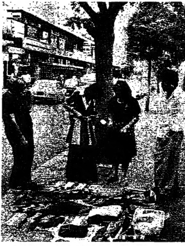
تنتشر على ارصفة المصراة

ادى استمرار انتشار البسطات التجارية في احياء القنطرة، بسبب حالة الازمة السائدة، الى ازدياد عدد البسطات الزمكية لبيع المبرسات على طرقات الجبل، والمصايف، وعلى ارصفة بعض الاحياء امس.